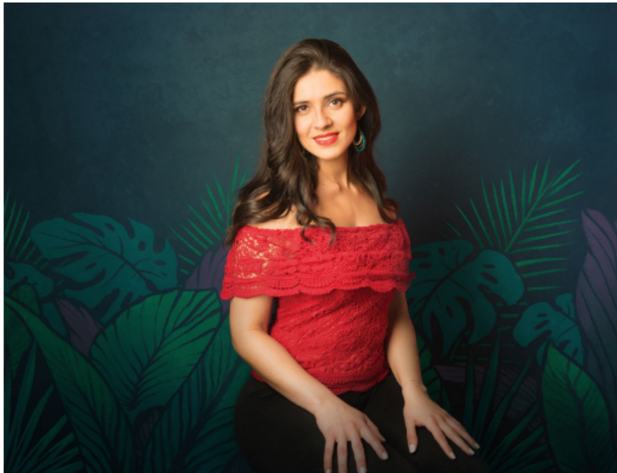
Ilustración: Antonio Javier Caparo