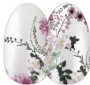
Flora Good Time FDS507 brillo