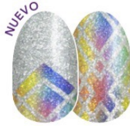
Bad Chrome-ance FDG321