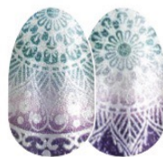
Drop & Give Me Zen FDS538 brillo