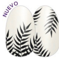
Palm Before the Storm FDL040 transparente