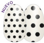
Polka Dot-com FDL041 transparente