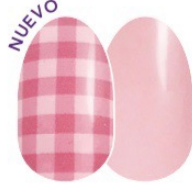
What the Check FDC267 brillo