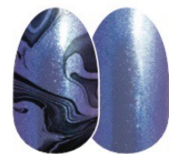
Northern Wonder FDS484 brillo