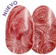
Blush Hour FDG320