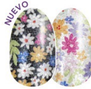
Daisy Me Rolling FDG319