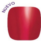
Baton Rougey FPC017 crema: $11