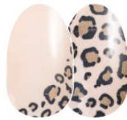
Trend Spotted FDC229 crema