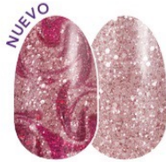
Feeling Marble-ous FDG322