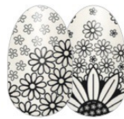
How's It Growing? FDL033 transparente