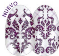
Kiss & Toile FDS568 brillo