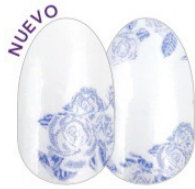
Floral of the Story FDF268 escarcha