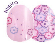
You Grow Girl FDC266 diseño de crema: $13