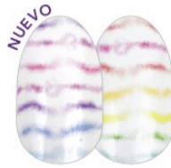
Hue Do Hue FDF269 escarcha