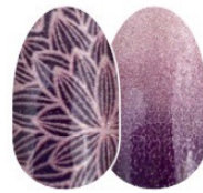
Rule of Plum FDS532 brillo