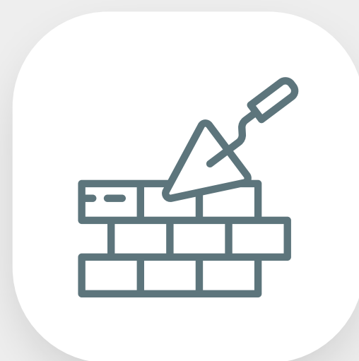
Reformas em geral