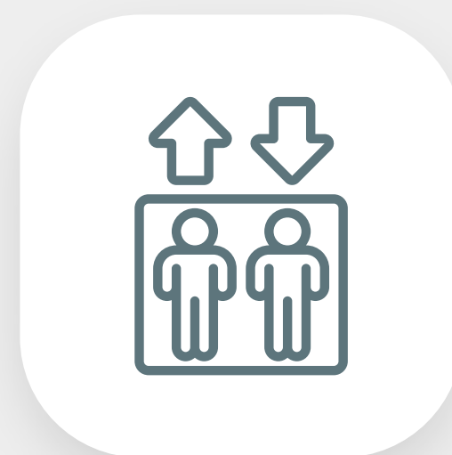
Modernização de elevadores