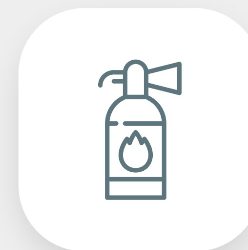
Adequações de AVCB