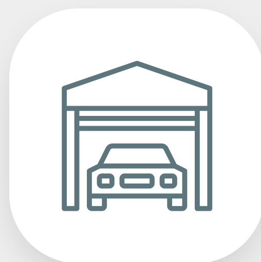
Cobertura de garagem