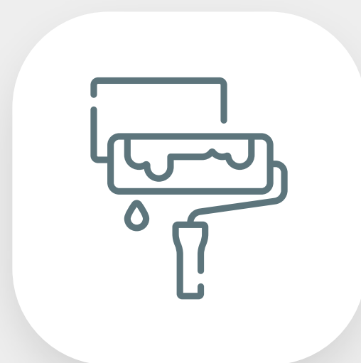
Pintura e restauração da fachada