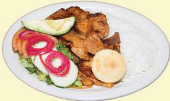
80) Chuleta frita $15.95 (Fried pork chop)