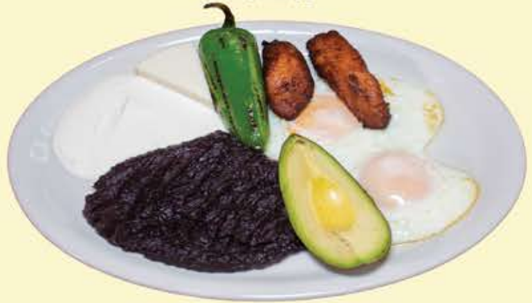
38) El Jalapaneco $10.95 2 Tortillas