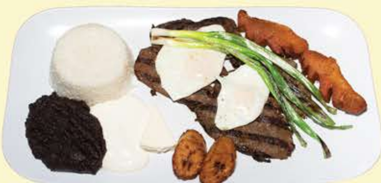
86) Asado jutiapaneco $21.95