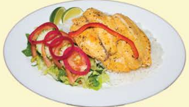
64) Tilapia sudada $16.95 (Steamed tilapia)