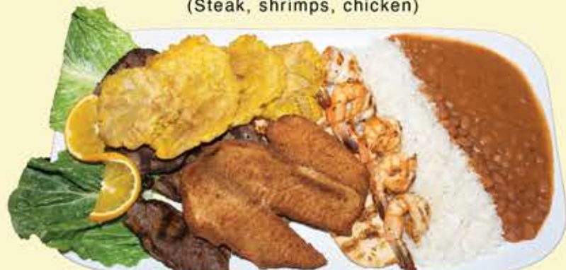
88) Audy's parrillada $33.95 (Steak, shrimps, chicken)