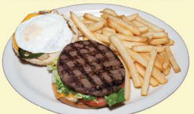
79) Chaparros queso hamburguesa con huevo $13.95 (Cheese burger, egg, onions, tomato, lettuce)