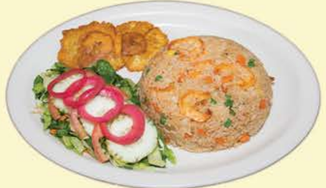
66) Arroz con camarones $17.95 (Shrimps w/ rice)