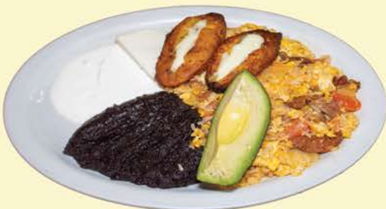
37) El Audy 3ro $11.95 2 Tortillas