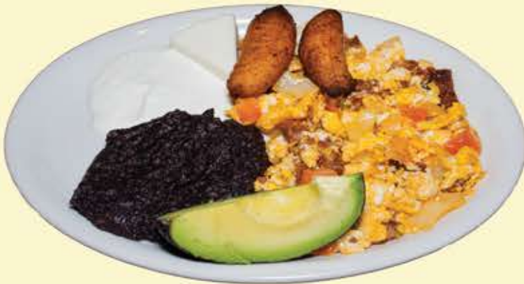
35) El Guatemalteco $10.95 2 Tortillas (The Guatemalan)