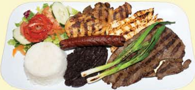
85) Parrillada cobanera $25.95