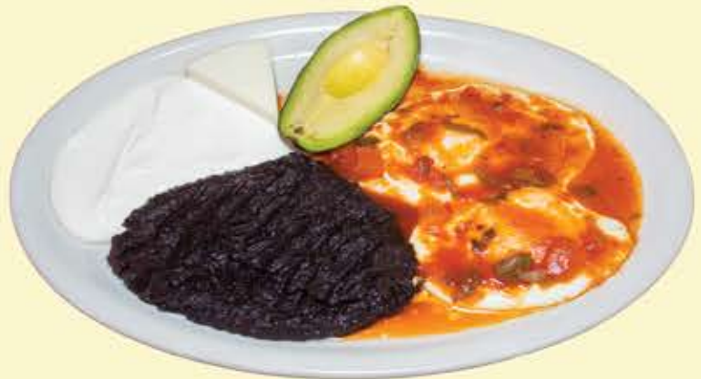
39) El Xelahu $11.95 2 Tortillas