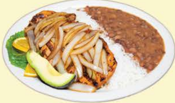
81) Chuleta encebollada $16.95 (Onion pork chop)