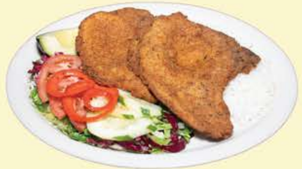
82) Chuleta empanizada $16.95 (Breaded pork chop)