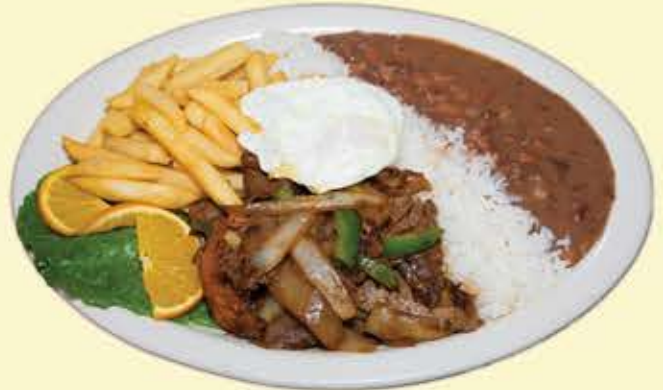
75) Leo's Style salteado $18.95 (Sauteed steak)