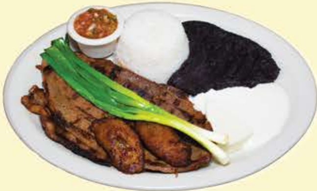
70) Churrasco guatemalteco $18.95 (Guatemalan steak)