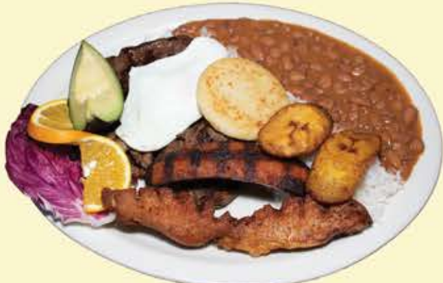
73) Bandeja típica con 1/2 chorizo $18.95 (Typical steak w/ 1/2 chorizo)