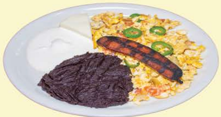
40) El campesino $10.95 2 Tortillas (the peasant)