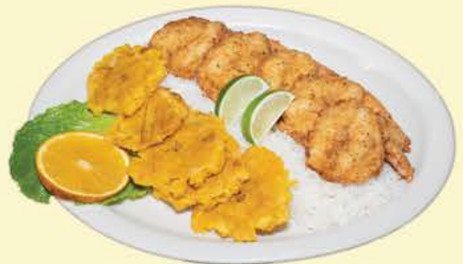
67) Camarones empanizados $18.95 (Breaded shrimps)