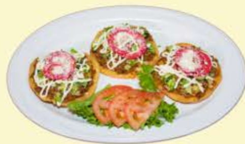
17) Garnachas $11.95

Todos los cambios adicionales tendran un costo (no hay substituciones)