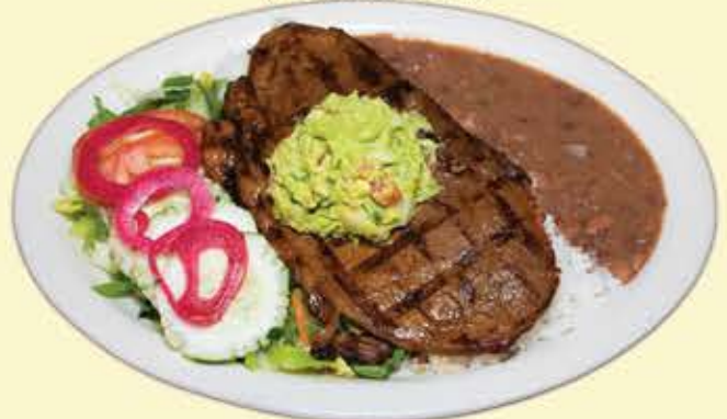
76) Churrasco campesino $17.95 (Peasant steak)