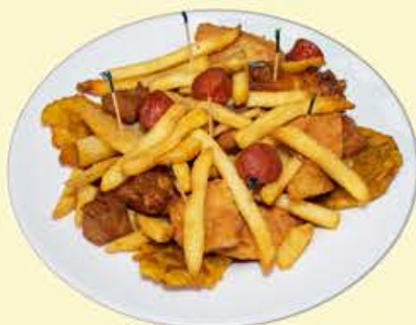
16) Picadera chaparros (1 o 2 personas) $17.95