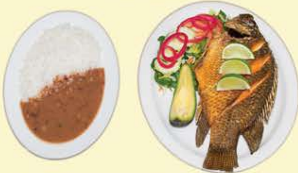
60) Mojarra frita $20.95 (Fried mojarra)