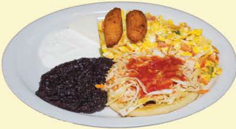
34) El Jutiapaneco $11.95