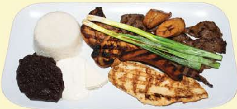
84) Parrillada jutiapaneca $25.95