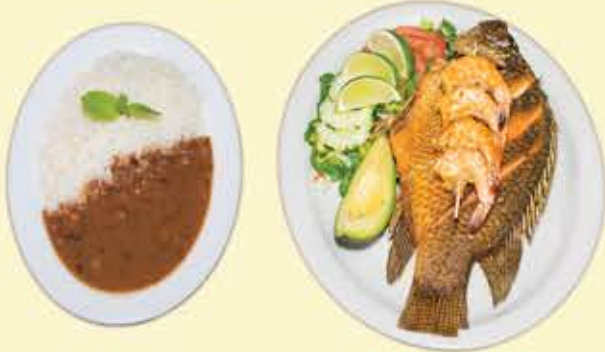
61) Mojarra con camarones $21.95 (Mojarra w/ shrimps)