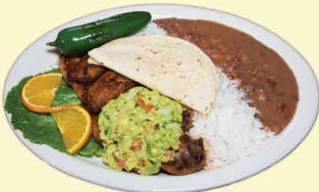
71) Steak a la mexicana $20.95