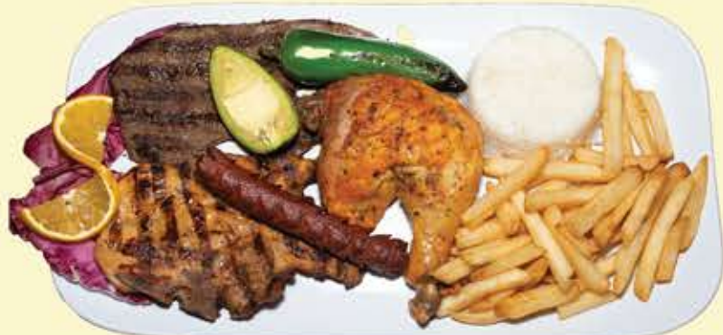
87) Parrillada jalapaneca $26.95