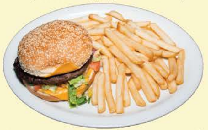
78) Audy's hamburguesa con queso $12.95 (sauteed onion, jalapeno and cheese)