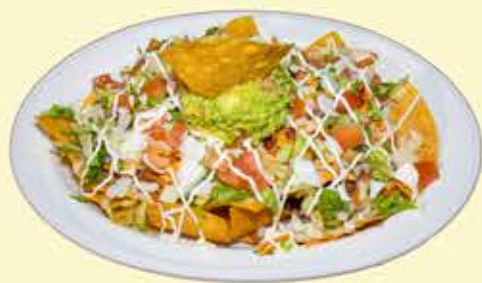
15) Nachos con pollo $12.95 (Nachos w/ chicken)