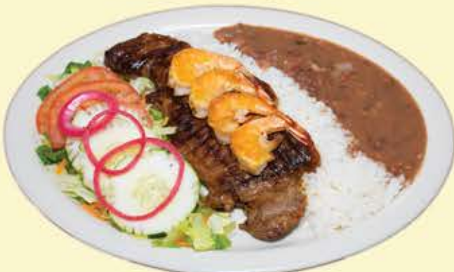
72) New York Steak con camarones $21.95 (with Shrimps)