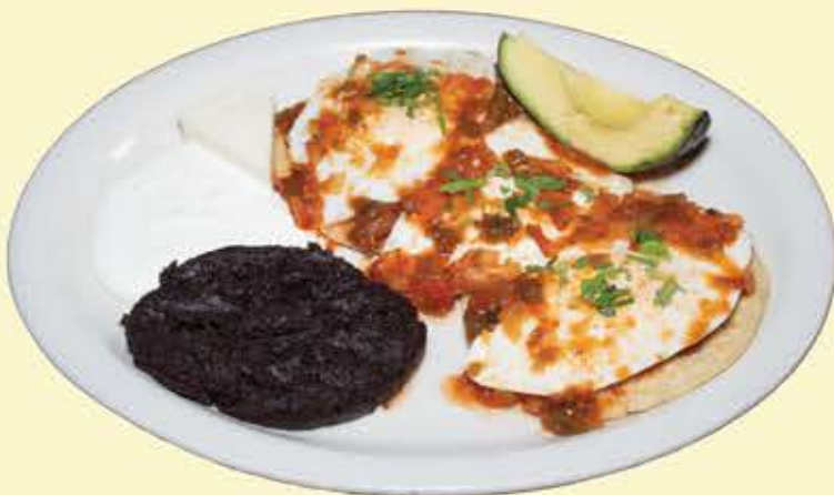
36) Huevos Rancheros 2 Tortillas $13.95 (Rancheros eggs)