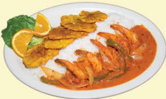
62) Camarones a la diablo $19.95 (Deviled shrimp)