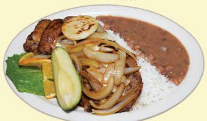
77) Steak encebollado $17.95 (With onions)