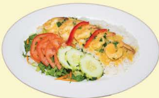
63) Camarones al mojo de ajo $18.95 (Shrimps w/ garlic sauce)