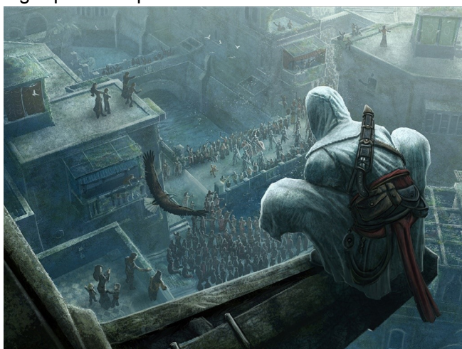
O Deus Azazyel (Azazel) - um matador sanguinolento

69 Depois disto o nome do Filho do homem, vivendo com o Senhor dos espíritos, foi exaltado pelos habitantes da terra. 2 Ele foi exaltado nas carruagens do Espírito e o seu nome estava no meio deles. 3 Desde aquele tempo eu não fui arrancado do meio deles; mas Ele assentou-se entre dois espíritos, entre o norte e o oeste, onde os anjos receberam seus cordões, para medir o lugar para os eleitos e os justos. 4 Ali eu vi os pais dos primeiros homens e os santos que habitam naquele lugar para sempre.