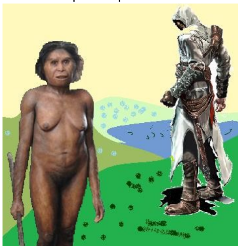
Muitos Deuses se poluíram sexualmente com as mulheres

6 Ai de vós [pecadores]; pois para vós não haverá paz. Nem podereis [mais] dizer aos justos e aos bons que vivem: “Nos dias da nossa aflição nós fomos afligidos; todo tipo de tristeza nós vimos, e muitas coisas más nós temos sofrido. 7 Nossos espíritos têm sido consumidos e diminuídos. 8 Nós temos perecido; nem tem havido uma possibilidade de ajuda para nós em palavra ou em obra; nós: não temos encontrado, mas temos sido atormentados e destruídos. 9 Nós não temos esperado viver dia após dia. 10 Nós esperamos certamente, ter sido a cabeça; 11 Mas temos nos tornado a cauda. Nós temos sido afligidos, quando temos nos esforçados; mas temos sido devorados pelos pecadores e mundanos; seu jugo tem sido pesado sobre nós. 12 Eles tem exercido domínio sobre nós, a quem eles detestam, e nos aferroam; e aqueles que nos odeiam tem humilhado nosso pescoço; e eles não têm mostrado compaixão para conosco.