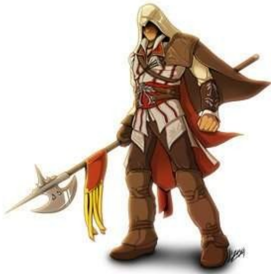
O Deus Azazyel (Azazel) ensinou iniquidades aos homens

carruagens com homens dirigindo-as. 2 E eles vieram sobre o vento do leste, desde o oeste, e do sul. (6) (6) Desde o sul. Literalmente "do meio do dia". (Laurence, p. 63). 3 O som do barulho de suas carruagens foi ouvido. 4 E quando aquela agitação aconteceu os santos fora do céu perceberam-na; o pilar da terra abalou-se desde a sua fundação e o som foi ouvido desde as extremidades da terra até às extremidades do céu ao mesmo tempo. 5 Então eles caíram e adoraram o Senhor dos espíritos. 6 Este é o fim da segunda parábola.