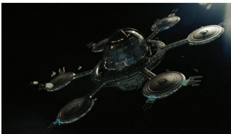
“Os céus” – ou, por séculos, “a casa dos Deuses”

Os pecadores clamarão, vendo-os, enquanto eles existem em esplendor e prosseguem em direção dos dias e períodos a eles prescritos.