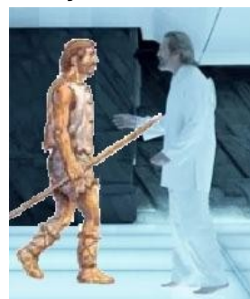
Enoque é instruído por um dos Deuses

62 “Então, aquela [primeira] ovelha, seu condutor [Moisés], que se tornou num homem, foi [também] separado delas, e [também] morreu. 63 Todo o rebanho procurou por ele, e clamou por ele com amarga lamentação.