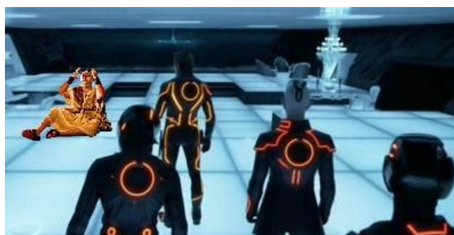
Nos "céus", Enoque viu muitos Deuses

31 Depois destas coisas, inspecionando as entradas do norte acima das montanhas, vi montanhas e percebi sete montanhas repletas de puro nardo, árvores odoríferas e papiro. 2 Dali eu passei acima dos picos daquelas montanhas a alguma distância para o leste, e fui sobre o mar da Eritreia. (6) E quando eu havia avançado para longe, além dele, passei ao longo, acima do anjo Zateel, e cheguei ao jardim da justiça. Neste jardim eu vi outras árvores, as quais eram numerosas e grandes, e floresciam ali. (6) Mar da Eritreia. O Mar Vermelho.