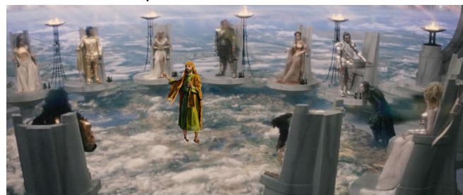
Enoque, em órbita da Terra, com os Deuses.

9 E os homens, sendo destruídos, clamaram, e suas vozes romperam os céus.