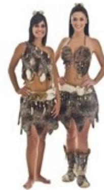
Deuses desejaram as mulheres – as “filhas dos homens”

89 “E eu observei durante o tempo, que assim trinta e sete (3) pastores estiveram inspecionando, todos dos quais terminaram em seus respectivos períodos como o primeiro. Outros então receberam-nos em suas mãos, para que pudessem cuidar delas em seus respectivos períodos, cada pastor em seu próprio período. (3)