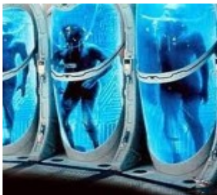
Há muitos Deuses presos no Tártaro

63 Eu vi outros semblantes naquele lugar secreto.