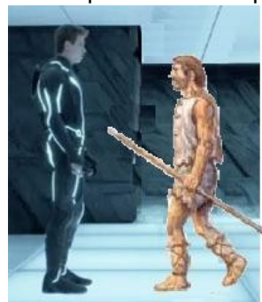
Enoque conversa com um dos Deuses

11 E eu abençoei o Senhor da glória, o eterno Rei, porque ele preparou esta árvore para os santos, formou-a, e declarou que Ele a daria para eles”.