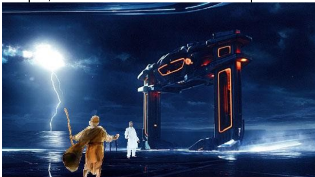
Enoque, recebido pelos Deuses

5 “Então o Senhor disse-me: 'Enoque, escriba da retidão, vai e dize às Sentinelas dos céus, os quais desertaram o alto céu e seu santo e eterno estado, os quais foram contaminados com mulheres. 6 E fizeram como os filhos dos homens fazem, tomando para si esposas, e os quais têm sido grandemente corrompidos na terra; 7 “ 'Que na terra eles nunca obterão paz e remissão de pecados'.” Pois eles “ 'não se regozijarão em sua descendência; eles verão a matança dos seus bem-amados; lamentarão a destruição dos seus filhos e farão petição para sempre; mas não obterão misericórdia e paz' ”.”