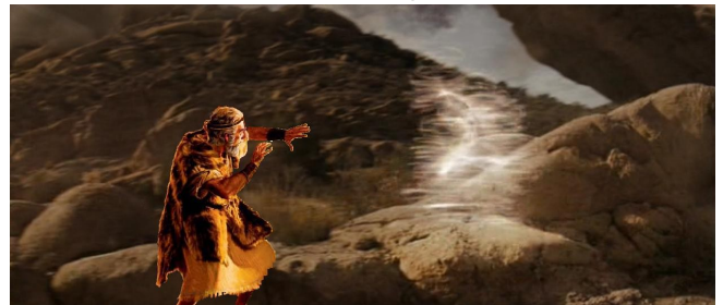
Um Deus se tele-transportou até Enoque, que 'andou com Ele'

98 Naqueles dias os pais serão derrubados com seus filhos na presença uns dos outros; e os irmãos com seus irmãos cairão mortos: até que um rio fluirá de seu sangue. 2 Pois um homem não conterà sua mão de [sobre] seu filho, nem dos filhos dos seus filhos; sua misericórdia estará em matá-los. 3 O pecador não conterà sua mão de seu irmão honrado. Desde o nascer do dia até o por do sol a matança continuará. O cavalo caminhará com dificuldade até à altura do seu peito, e a carruagem afundará até seu eixo no sangue dos pecadores.