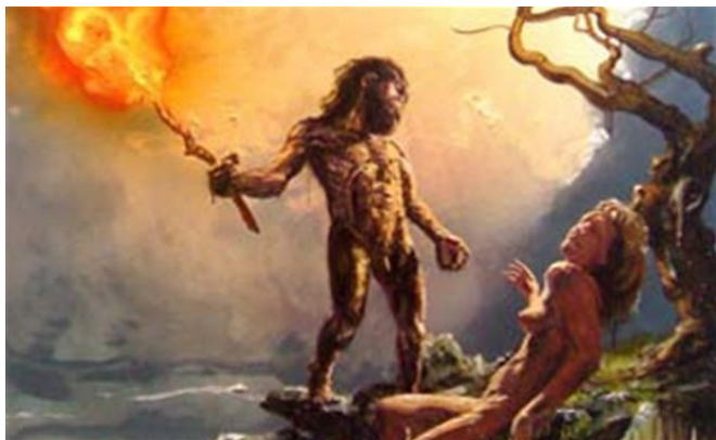
Os filhos dos Deuses eram violentos e canibais

78 E então, meu filho Matusalém, eu te mostrei tudo; e o relato de toda ordenança das estrelas do céu está terminado.