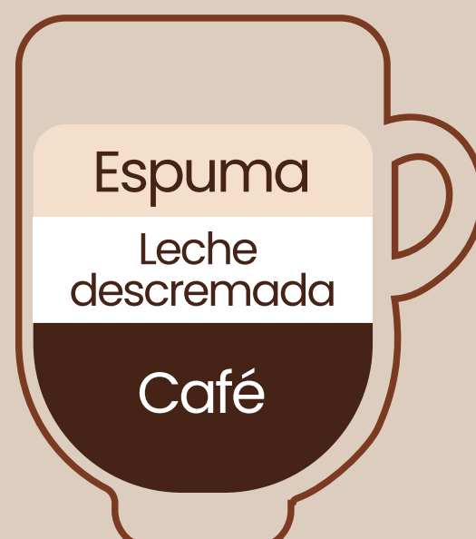
Capuccino light $3.00