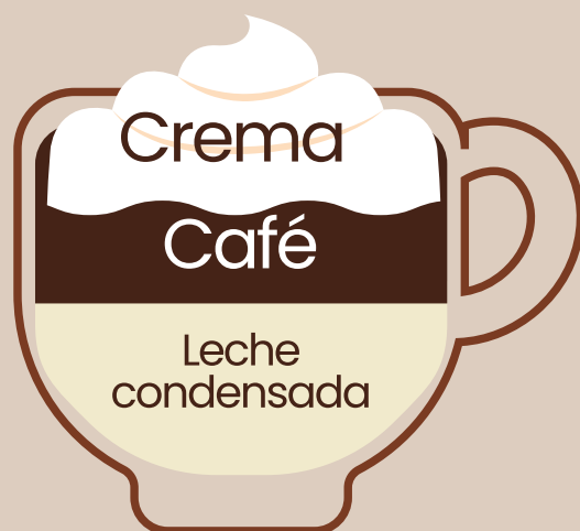
Café Bombón $3.00