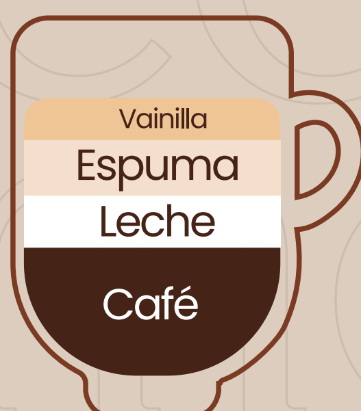
Capuccino de vainilla $2.75