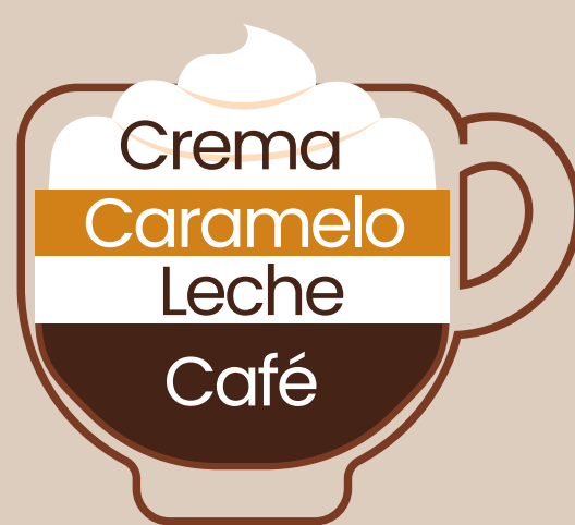
Caramel macchiato con crema $3.25