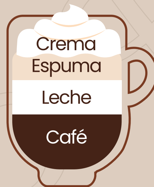
Capuccino con crema $2.75