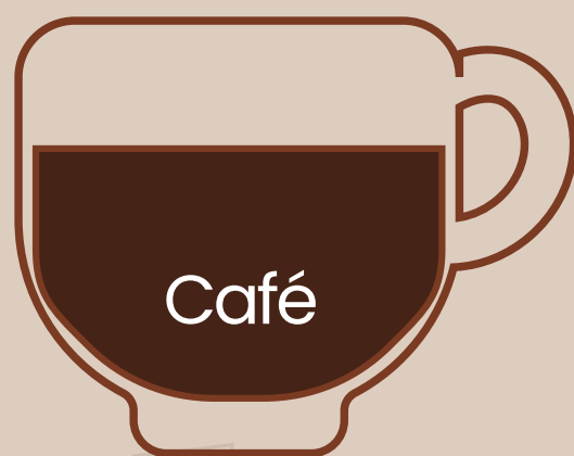
Espresso doble $2.00