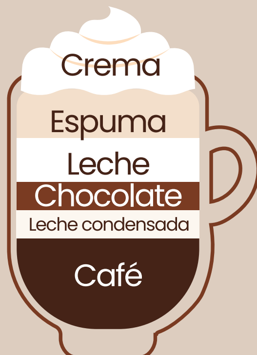
Mocaccino con crema $3.25