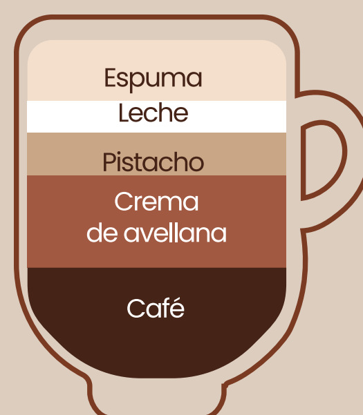
Mocaccino avellana & pistacho $3.50