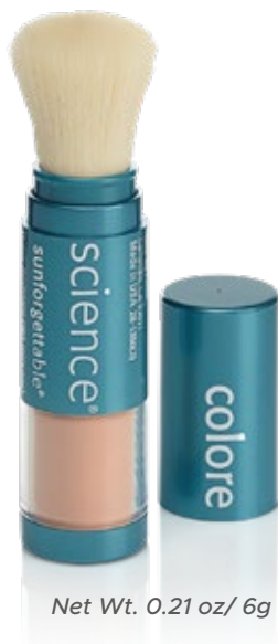
Net Wt. 0.21 oz / 6g