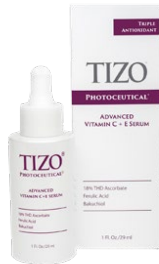
Net wt. 1fl. oz / 29 ml