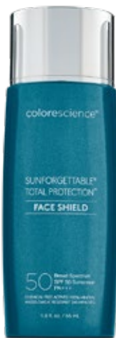
1.8 fl oz / 55 ml