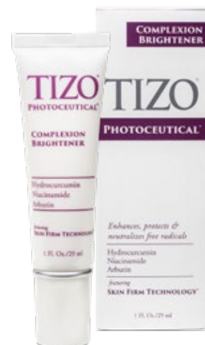
Net wt. 1 fl. oz. (29ml)