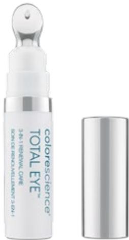
Net Wt. 0.23 oz / 7ml