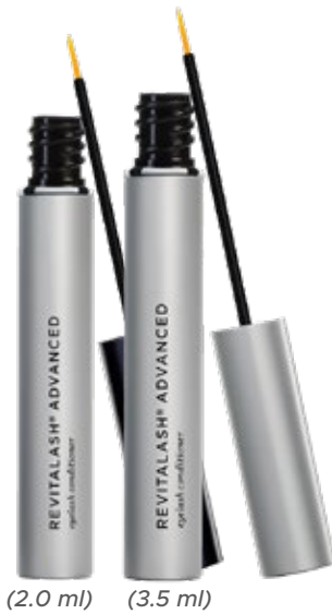
(2.0 ml) (3.5 ml)