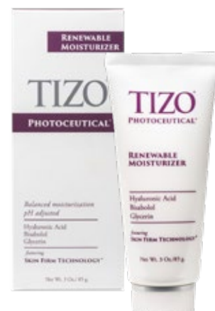
Net wt. 3 oz. (85g)